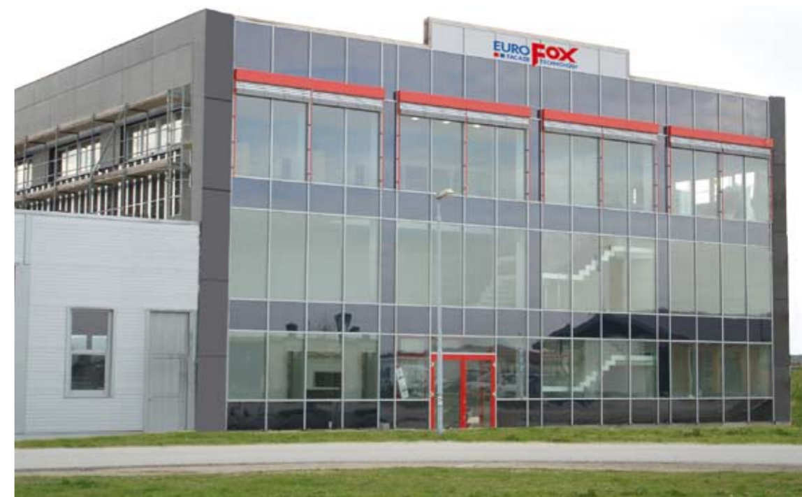
EUROFOX Vertriebsges.m.b.H., A-2821 Lanzenkirchen, Gewerbepark 10 Tel. +43 (0)2622 69001-0, www.eurofox.com Werbung